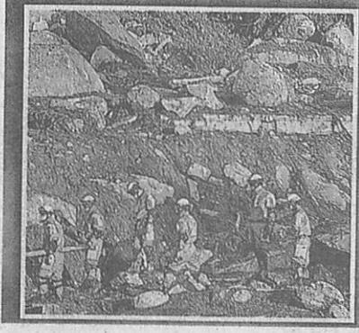
大勢の人が身を寄せた長野市の

週末は前線が停滞した影響で、昨年の台風15、19号の被害による災害が起きやすい「出水」、日本近海は海面水温が高い豪雨をもたらし、台風の勢力 週末は前線が停滞した影響で、昨年の台風15、19号の被害による災害が起きやすい「出水」、日本近海は海面水温が高い豪雨をもたらし、台風の勢力